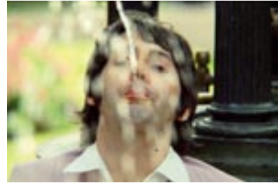
10. Water Water Everywhere