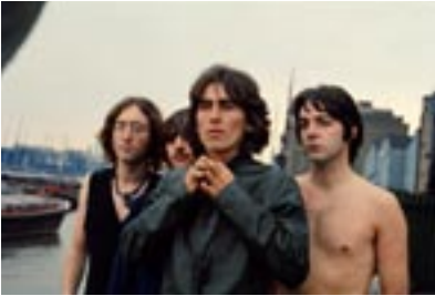
5. Scene From Thames II