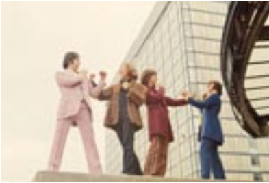
9. Things To Come