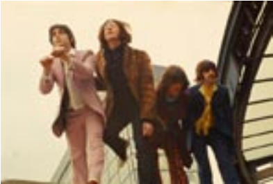
3. Ready Set Go