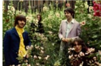
12. Flower Power II