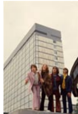
22. Balancing Act