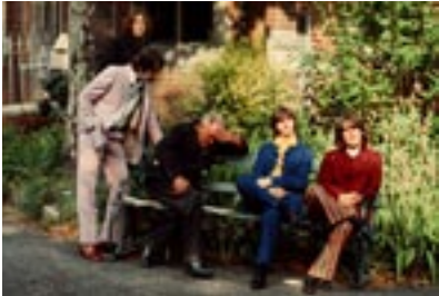
1. Nowhere Man