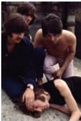
23. Untitled II