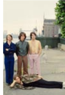
18. Dockside Then I