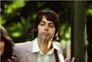
13. The Fountain