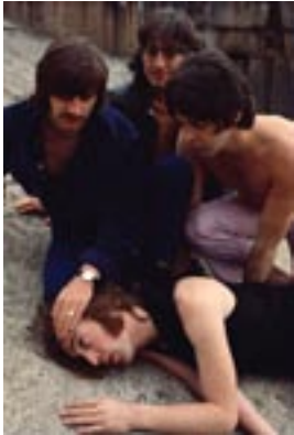
17. Untitled I