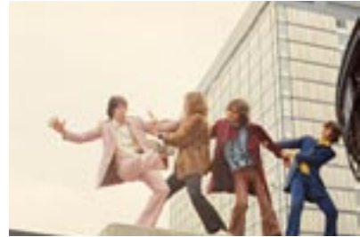
6. Comming Apart