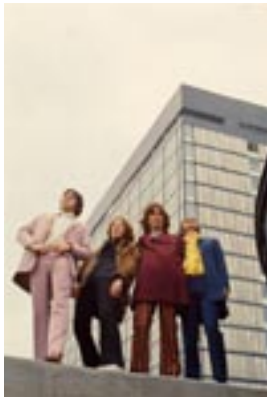
21. Standing Tall