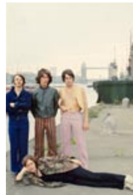
20. Dockside Then II