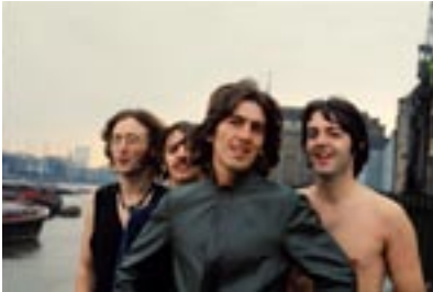
4. Scene From Thames I