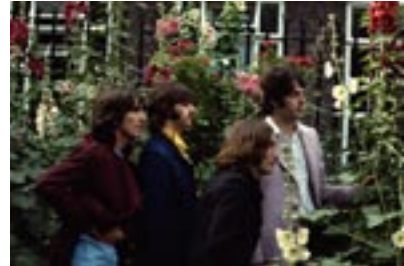
14. All Together Now