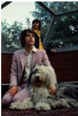
15. Martha My Dear