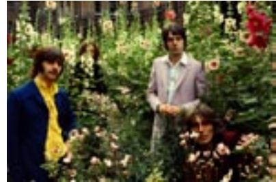
2. Flower Power I