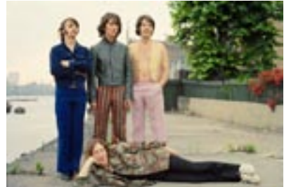
8. The Docks